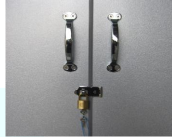
握り易いハンドル 堅牢な南京錠